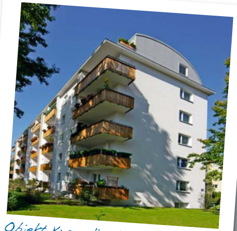
Objekt Kraepelinstraße in München-Schwabing-West für vorbildliche Sanierung

Die GBW Gruppe hat sich mit neun ihrer Bauvorhaben für den diesjährigen Ehrenpreis der Landeshauptstadt München (LHM) beworben. Der Preis wird in den drei Kategorien „Guter Wohnungsbau“, „Wohnen im Alter“ sowie „Vorbildliche Sanierung“ vergeben. Unter rund 50 eingereichten Bauvorhaben muss die Jury die Gewinner wählen. Die Preisverleihung soll im Herbst stattfinden. Beim letzten Ehrenpreis der LHM im Jahr 2005 gewann die GBW einen Ehrenpreis und erhielt eine Anerkennung.